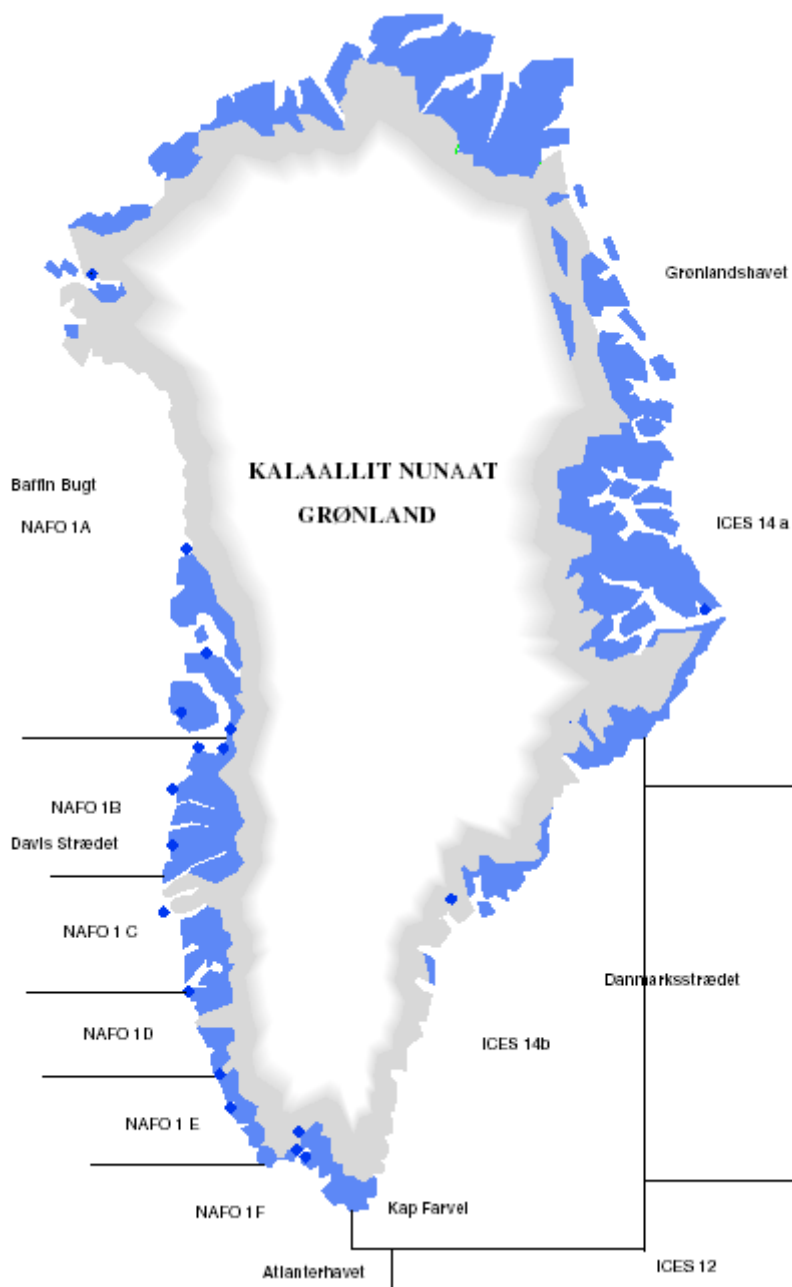
Figur 2 Kort over det grønlandske søterritorium med NAFO- og ICES-områder.